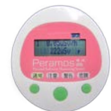
自社製品：パラコス