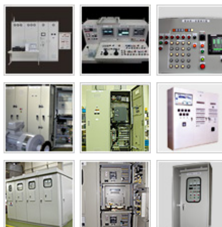
高圧受変電設備、低圧配電設備 設計・製作